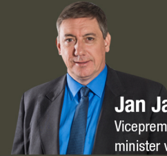
Jan Jambon Vicepremier, minister van Veiligheid en Binnenlandse Zaken